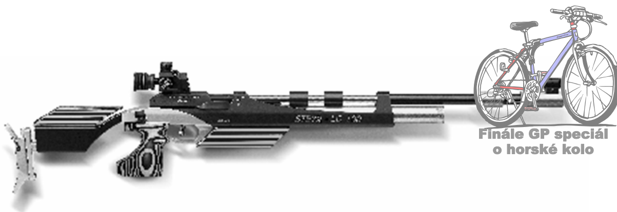
Finále GP speciál o horské kolo

Vzduchová puška 40, 60 ran Vzduchová pistole 40, 60 ran